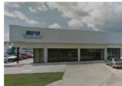
Industrial Plastic & Machine Inc. U.S.A.