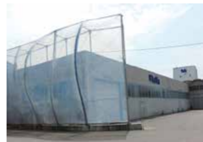
P.A.T.I. S.p.A. Italy