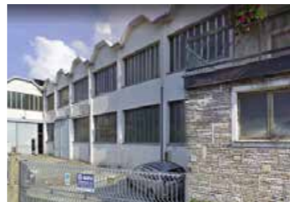
Ghivi s.r.l. Italy