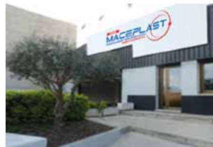
Maceplast España S.L. Spain