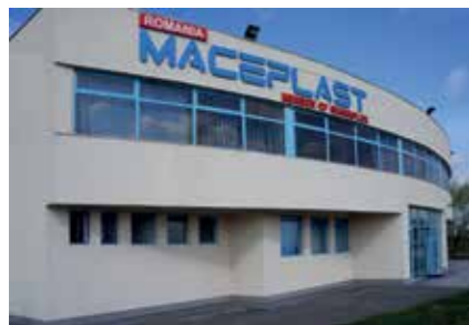
Maceplast Romania S.A. Romanie