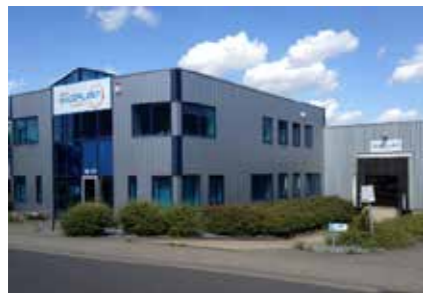
Maceplast GmbH Germany