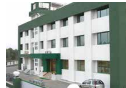
Guarniflon India PVT I.t.d. India