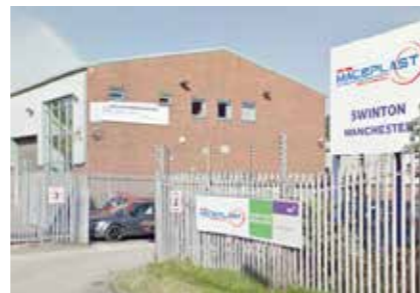
Maceplast U.K. Ltd United Kingdom