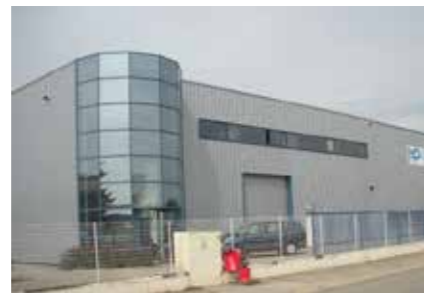
Maceplast S.A. France